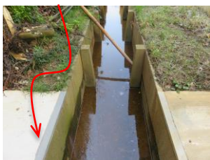
①水路への対策工事