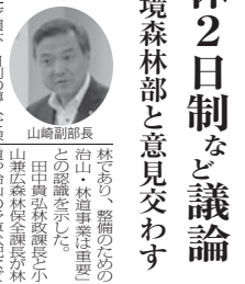
林業協会の意見交換会