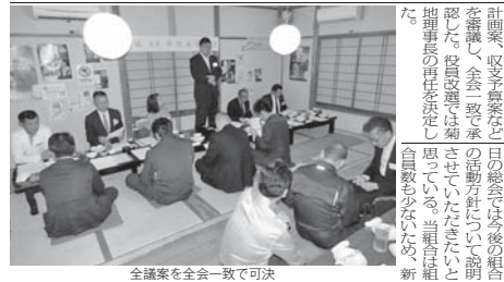
全議案を全会一致で可決