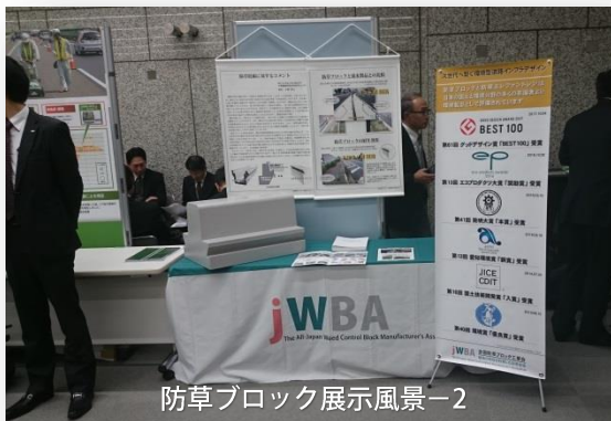
防草ブロック展示風景-2