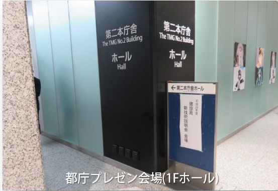
都庁プレゼン会場(1Fホール)

東京都の新技术として13社の製品・技術の展示会とプレゼンテーションが 都庁第二本庁 二庁ホールで開催されました。(主催：東京都建設局)