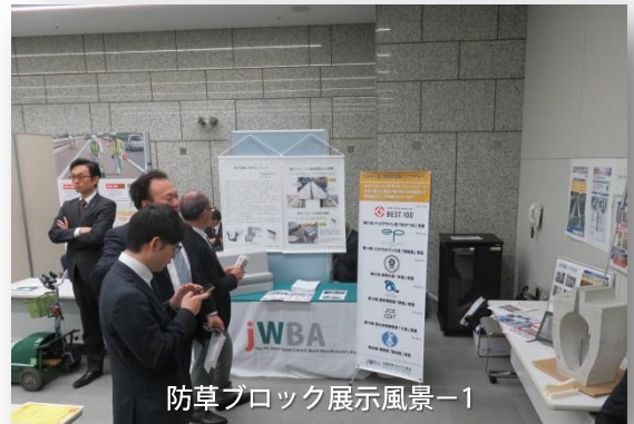
防草ブロック展示風景-1