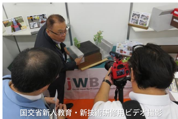
国交省新人教育・新技術研修用ビデオ撮影

開催場所/吹上ホール(名古屋市千種区) 主催/国土交通省中部地方整備局 来場10/16(7732名)、17(7153名)2日間: 14,885名