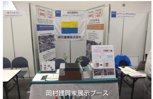
岡村建興(株)展示ブース