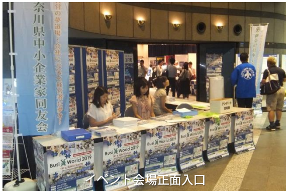
イベント会場正面入口

横浜ベイスターズ、湘南ベルマーレのマーケティングとブランディング戦略、ブラックホールの撮影秘話、また中小企業に必要な新たな価値観の創出を求めイノベーションセミナーの開催もあり、多くの来場者の興味を引き出しました。 [出展：岡村建興(株)]