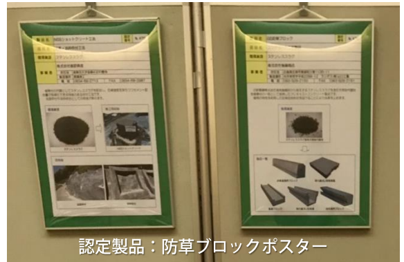
認定製品：防草ブロックポスター