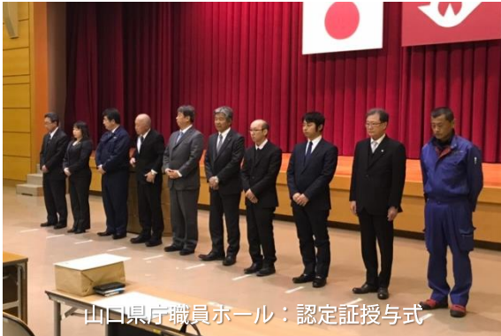
山口県庁職員ホール：認定証授与式

認定式には市町、県より多くの関係団体が集り、佐伯環境生活部長の挨拶からはじまり、認定リサイクル製品／12製品、エコ・ファクトリー／2事業者を紹介、認定証が授与され、その後利用拡大の取組や認定製品の活用事例などが発表されました。