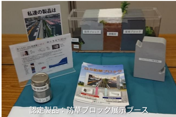
認定製品：防草ブロック展示ブース